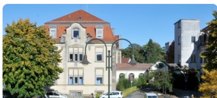
EHPAD de Mulhouse - Hasenrain