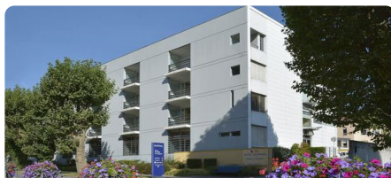
EHPAD de Cernay