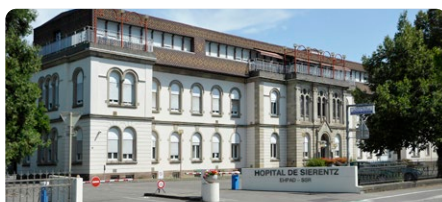
EHPAD de Sierentz