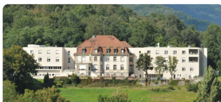
EHPAD de Bitschwiller-lès-Thann