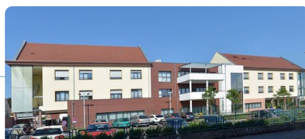
EHPAD de Rixheim

EHPAD : 105 lits dont 15 lits UVP - USLD : 20 lits