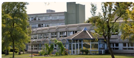
Maison Médicale pour Personnes Agées de Mulhouse (MMPA)