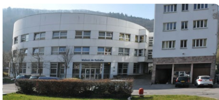
EHPAD de Thann