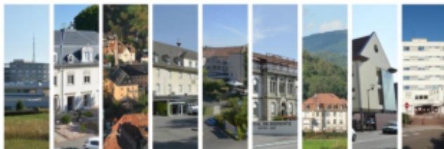
Site de Mulhouse Emile Muller - Site de Mulhouse Hasenrain - Site de Thann - Site d'Altkirch - Site de Cernay Site de Sierentz - Site de Bitschwiller-lès-Thann - Site de Rixheim - Site de Saint-Louis