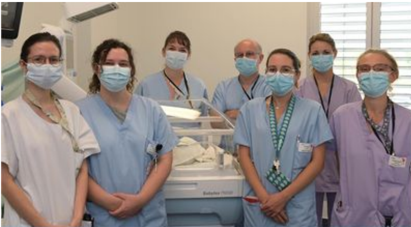
L'unité de néonatalogie du GHRMSA bénéficie de l'arrivée d'une nouvelle génération de médecins, fruit d'une collaboration avec le service de néonatalogie du CHU de Strasbourg.