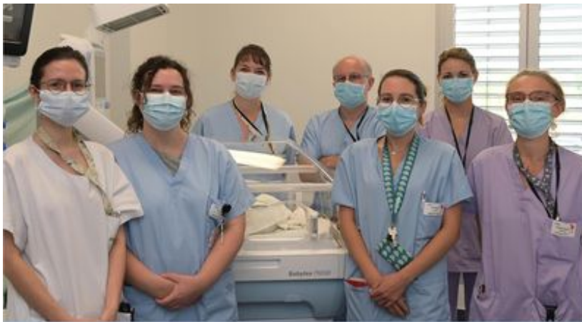
L'unité de néonatalogie du GHRMSA bénéficie de l'arrivée d'une nouvelle génération de médecins, fruit d'une collaboration avec le service de néonatalogie du CHU de Strasbourg.